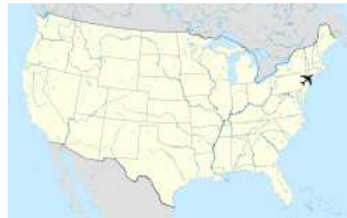
Mappa di localizzazione

voci di incidenti aerei presenti su Wikipedia