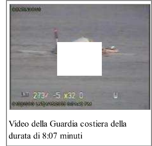
Video della Guardia costiera della durata di 8:07 minuti

Nonostante l'intenzione iniziale di tentare un atterraggio d'emergenza presso l'aeroporto di partenza, Sullenberger si rese conto ben presto che un tentativo di ritornare a La Guardia sarebbe fallito ed informò di conseguenza il controllo del traffico aereo di volere invece tentare un atterraggio in New Jersey, presso il Teterboro Airport. [27][31][32] Immediatamente il controllore di volo contattò quindi il Teterboro Airport informando la torre che il volo 1549 richiedeva il permesso di effettuare un atterraggio d'emergenza. [31] Il comandante Sullenberger si rese però conto che anche questa destinazione si trovava ad una distanza eccessiva e che