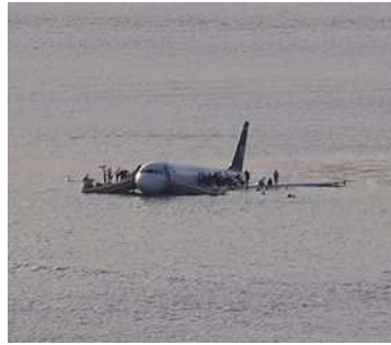
US Airways 1549

Ai comandi del volo 1549 al momento del decollo dall'aeroporto la Guardia di New York si trovava il copilota Skiles, che fu anche il primo a notare lo stormo di uccelli a quota 3200 piedi dirigersi verso l'apparecchio due minuti dopo che quest'ultimo era decollato. [23] La collisione con lo stormo avvenne alle ore 15:27:01 [24] quando pilota e copilota riferirono di avere sentito alcune forti scosse nella sezione frontale dell'aereo. [25] In seguito all'impatto con lo stormo entrambi i motori dell'apparecchio furono investiti dalle carcasse di diversi volatili e persero rapidamente potenza. [23] Il capitano Sullenberger riprese immediatamente i comandi dell'apparecchio mentre il copilota Skiles avviò la procedura di emergenza per riavviare i motori che nel frattempo si erano spenti. [23]