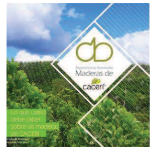
Do & CACERI DO una nota de diseño Breve descripción de las cualidades de la madera maciza acacia mangium, características de...