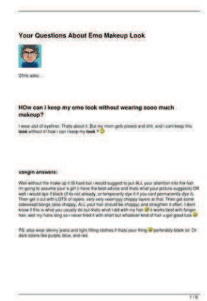
Your Questions About Emo Makeup Look s1tesh4re