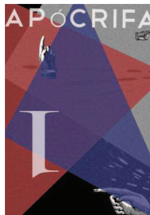
Apócrifa 1 Colectivo Pré-Contemporâneo