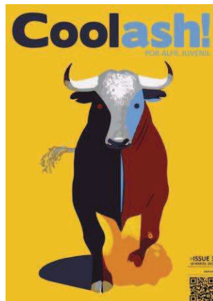
Coolash! - Número 3 Coolash! Alfil Juvenil